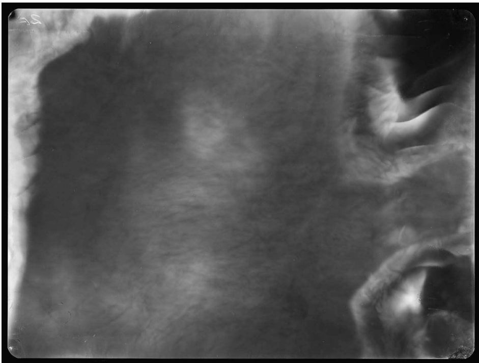
Projeto Chernobyl, Fragmento de um campo III e V - 9, 120 \mu\text{Sv} , de Alice Miceli. Impressão por contato radiográfico, 30cm x 40cm, 2011