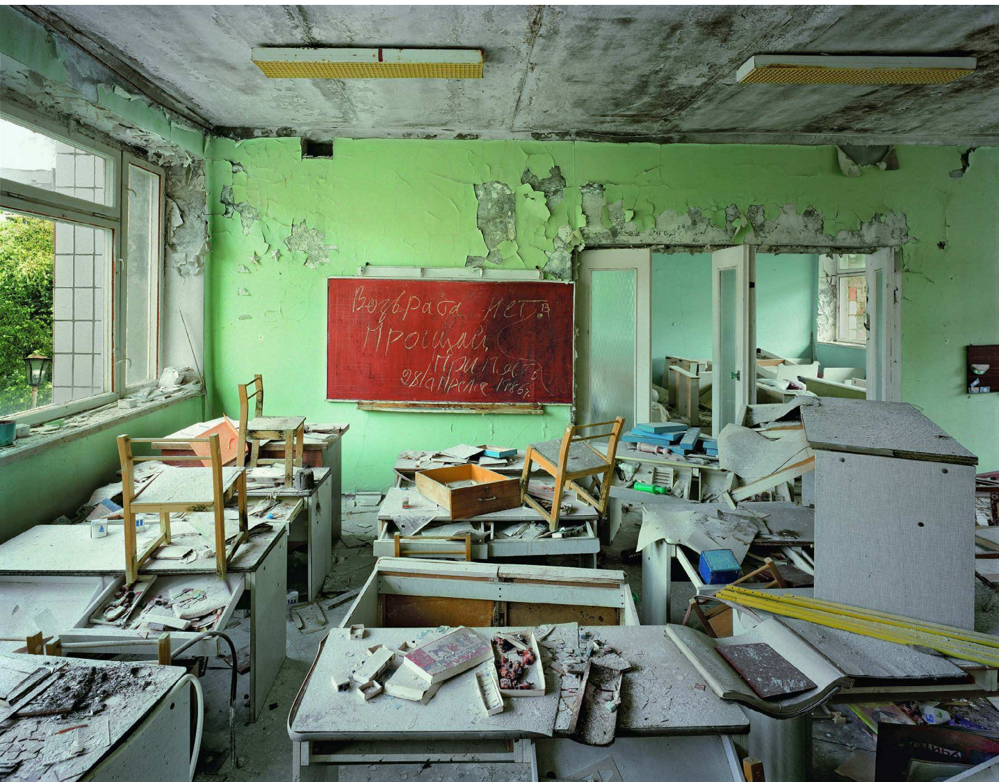
Zonas de Exclusão - Pripyat e Chernobyl, Robert Polidori. (C) Robert Polidori 2001